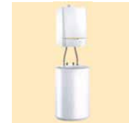
MCA 15-25-35 BS 60

Ketel Boiler H 690 mm H 912 mm B 450 mm Ø 570 mm D 450 mm 63 kg 34 kg