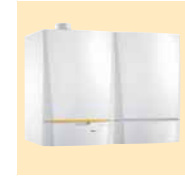
MCA 25/28 BIC