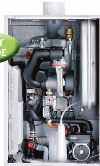
Innovens MCA 15